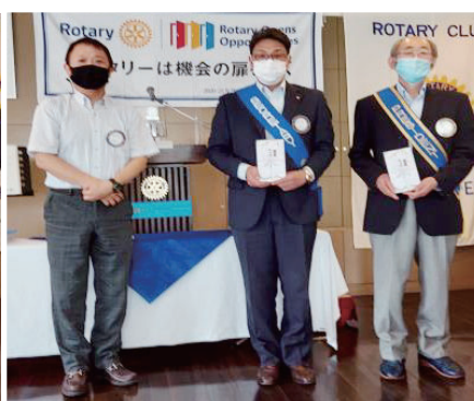
会長・幹事 記念品贈呈