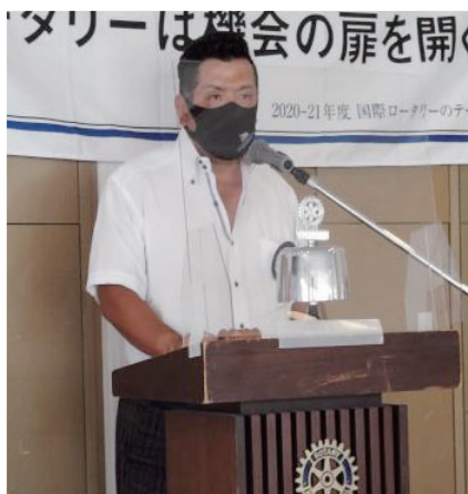
大原国際委員長 活動報告