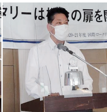
長野出席委員長 活動報告