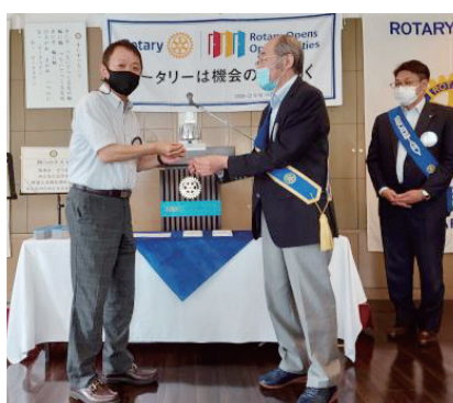
新旧会長パッチ交換