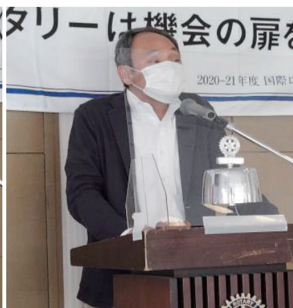
藤代クラブ広報統括委員長 活動報告